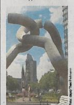
Die Skulptur „Berlin“

Touristen müssen vorübergehend auf ein beliebtes Fotomotiv in der Tauentzienstraße verzichten: Die Skulptur „Berlin“ aus sternen Stahlröhren verliert wegen der Sanierung der U-Bahntunnel und der geplanten Neugestaltung des Mittelstreifens ihren Platz am Europa-Center. Laut Bezirksbaustadtrat Klaus-Dieter Gröhler (CDU) wird sie eingelagert und, falls nötig, restauriert. Im Herbst 2011 oder im